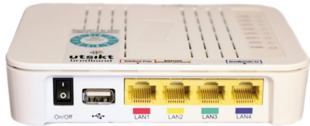
Kräver ström 220 V